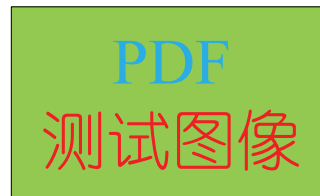
(b) PDF Figure

Please do not mix EPS and PDF/PNG/JPG figures! (a) EPS Figure