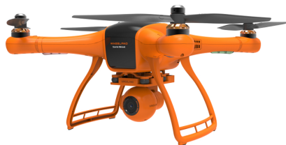
Figura 1.1: Vehículo aéreo no tripulado.

Lorem ipsum dolor sit amet, consectetur adipiscing elit. Ut purus elit, vestibulum ut, placerat ac, adipiscing vitae, felis. Curabitur dictum gravida mauris. Nam arcu libero, nonummy eget, consectetur id, vulputate a, magna. Donec vehicula augue eu neque. Pellentesque habitant morbi tristique senectus et netus et malesuada fames ac turpis egestas. Mauris ut leo. Cras viverra metus rhoncus sem. Nulla et lectus vestibulum urna fringilla ultrices. Phasellus eu tellus sit amet tortor gravida placerat. Integer sapien est, iaculis in, pretium quis, viverra ac, nunc. Praesent eget sem vel leo ultrices bibendum. Aenean faucibus. Morbi dolor nulla, malesuada eu, pulvinar at, mollis ac, nulla. Curabitur auctor semper nulla. Donec varius orci eget risus. Duis nibh mi, congue eu, accumsan eleifend, sagittis quis, diam. Duis eget orci sit amet orci dignissim rutrum. Nam dui ligula, fringilla a, euismod sodales, sollicitudin vel,